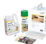
VEDLIKEHOLDS- PAKKE FOR GULV (Side 36)