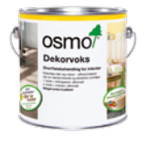
DEKORVOKS (Side 22 – 23)