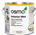
INTERIØR VOKS (Side 26)