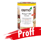
HARDVOKS-OLJE PROFF (Side 17)