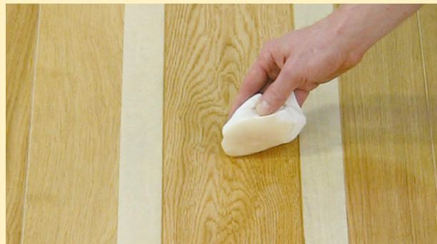
Etter tørk, påfør det andre strøket meget tynt med en lofri klut.