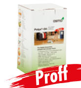
HARDVOKS-OLJE 2K (Side 14)