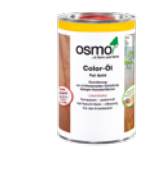
PIGMENTERT OLJE PROFF (Side 20)