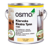
KLARVOKS EKSTRA TYNN (Side 25)