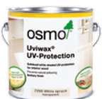
UVIWAX UV- BESKYTTELSE (Side 26)