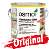
HARDVOKS-OLJE ORIGINAL (Side 16)