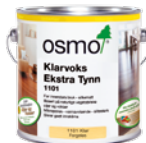
KLARVOKS EKSTRA TYNN (Side 26)