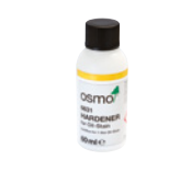
HERDER FOR OLJEBEIS (Side 21)