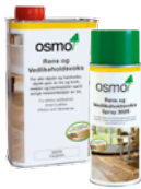
RENS OG VEDLIKE- HOLDSVOKS (Side 28)