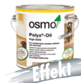
HARDVOKS-OLJE EFFEKT NATURELL (Side 18)