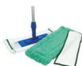
OPTI-SET (Side 37)