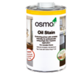
OLJEBEIS (Side 21)