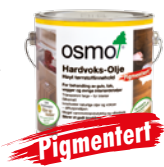
HARDVOKS-OLJE PIGMENTERT (Side 20)