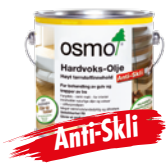
HARDVOKS-OLJE ANTI-SKLI / ANTI-SKLI EXTRA (Side 18)