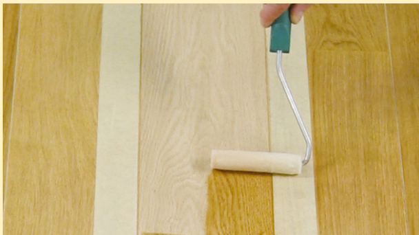
Påfør Osmo Hardvoksolje tynt med Mikrofibrullen.