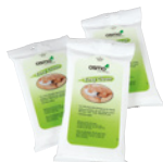
EASY CLEAN (Side 36)