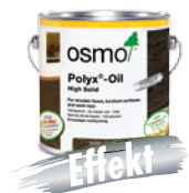
HARDVOKSOLJE EFFEKT SØLV / GULL (Side 19)