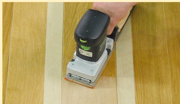
Slip den skadede overflaten grundig.