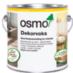
DEKORVOKS (Side 22 – 23)