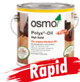
HARDVOKS-OLJE RAPID (Side 16)