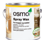
SPRAY WAX (Side 24)