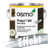
HARDVOKS-OLJE EFFEKT SØLV / GULL (Side 19)